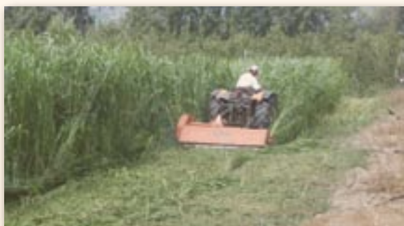
1 ère coupe en juillet

Un réseau de 7 parcelles à replanter en pommier a été suivi en 2007 sur la région PACA. Sur les parcelles où le sorgho (variété Piper) s'était bien développé, les mesures de croissance ont montré une augmentation de la longueur des pousses annuelles en fin de 1ère feuille de l'ordre de 90%. Durant la phase de développement des 3 premières feuilles, la circonférence du tronc a progressé de près de 25% par rapport au témoin sans sorgho.