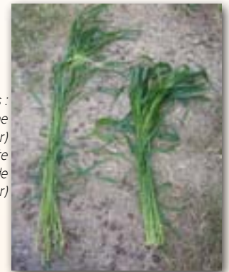
2 variétés : à gauche Sudan Grass (Piper) à droite variété hybride (Jumbo Star)

*Nb de graines moyen/m 2 pour une densité de 50kg/ha