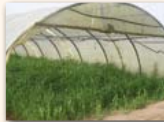
Sorgho sous tunnel

Le sorgho est une espèce rustique qui se contente des réserves du sol en éléments fertilisants. Des sols trop riches en azote peuvent provoquer le phénomène de verse. Sur des sols trop pauvres, un apport d'engrais azoté en cours de culture peut éviter un manque de croissance et des chloroses.