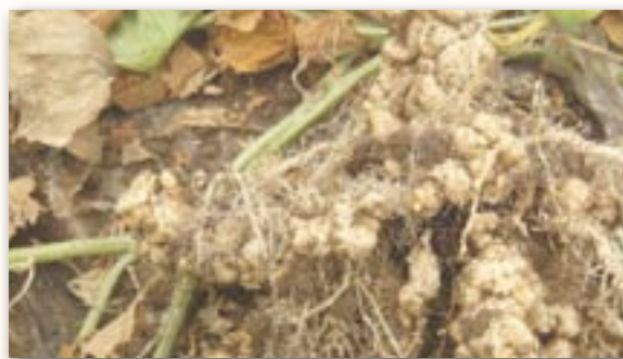
Nématodes sur racines de melon

Les nématodes sont capables d'effectuer leur cycle de développement sur la plupart des variétés de sorgho testées mais moins facilement que sur les espèces maraîchères. Ces dernières années, l'intérêt du sorgho fourrager pour l'assainissement du sol, notamment vis à vis des nématodes, a été étudié par l'APREL, le GRAB, le Ctifl et l'INRA PACA Sophia-Antipolis. Deux modes d'action possibles ont été mis en évidence :