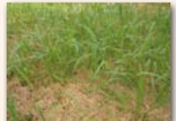
Repousse du sorgho après une première coupe